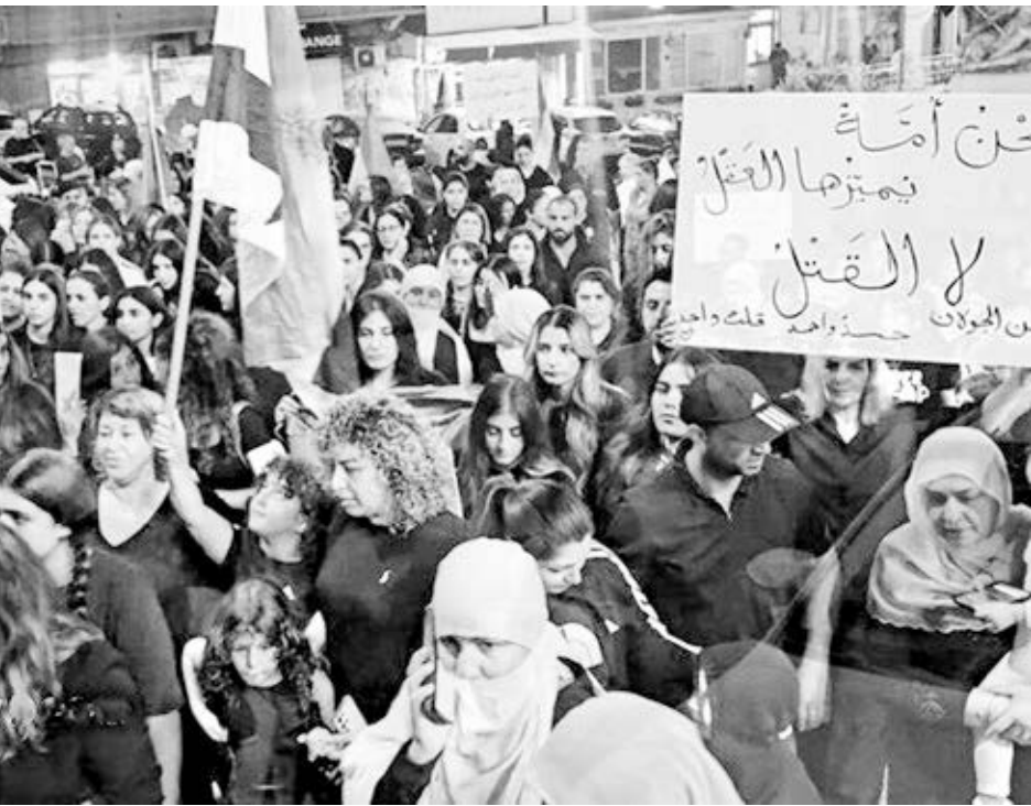
Jawlany.com/toma de video

El 22 de julio, el sindicato extendió los piquetes a establecimientos de Airgas en Indiana, Illinois, Missouri, Michigan y California. Cientos de miembros de los Teamsters están respetando las líneas de piquetes en unas